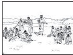
“JESUS ALIMENTA 5 MIL”

Quando Jesus partiu os pães e os peixes, estes começaram a multiplicar-se em Suas mãos.